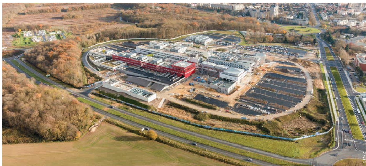
Implanté en face du Champ de Foire, à Melun, le Santépôle concrétise un projet sanitaire de territoire majeur pour lutter contre l'émiettement des structures de santé.

Le personnel des fonctions supports (services administratifs, techniques, logistiques, laboratoires,...) a d'ores et déjà investi les lieux, début mai. Les patients s'installeront progressivement à partir du 4 juin, avec un étalement du transfert des services sur 4 semaines. D'abord le centre psychiatrique Constance Pascal, les services de médecine et de chirurgie, puis les urgences et la maternité, le 21 juin. La clinique Saint-Jean l'Ermitage s'installera à son tour fin juin. ■